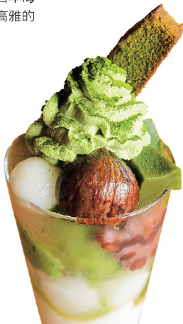
抹茶為日本茶的最佳代表，作為甜點品嘗也別有一番風味。