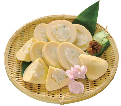
日本春季代表性美食——竹筍，以各式各樣的料理方式烹煮，滿足您的味覺，讓您大快朵頤。