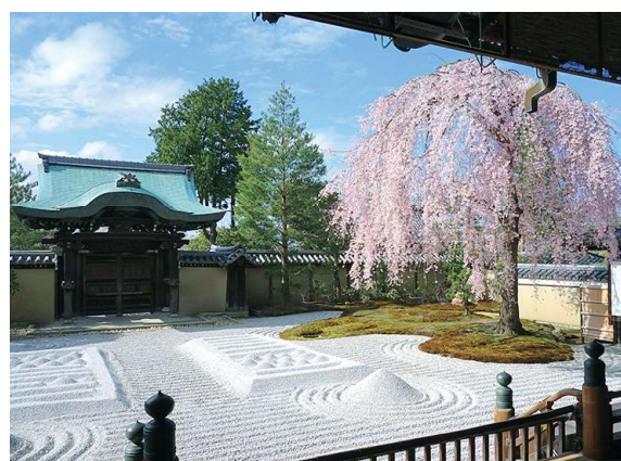
高台寺 MAP 20

16 世紀叱吒風雲的領導者豐臣秀吉去世後，其元配寧寧為祈求亡夫冥福而修建了高台寺。春天櫻花季與秋天紅葉季時，皆有舉辦夜間點燈活動。