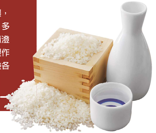
京都各地有多處歷史悠久的酒藏，孕育出多種具有特色的日本酒。

京都受惠於優良的水質與肥沃的土壤，因此發展出獨特的飲食及手作文化。多種活用時令食材原味的料理、口感清澄透徹的日本酒、職人以精湛的手藝製作的和服……請務必來京都一趟，體驗各式各樣帶有當地特色的文化產品。