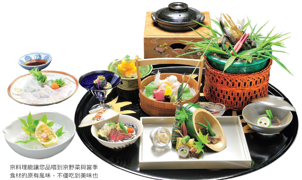
京料理能讓您品嚐到京野菜與當季食材的原有風味，不僅吃到美味也吃得到日式料理的精髓。