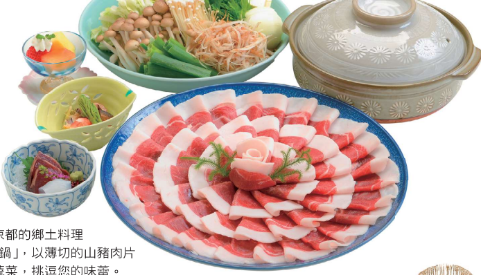
森之京都的鄉土料理「牡丹鍋」，以薄切的山豬肉片嫩煮蔬菜，挑逗您的味蕾。