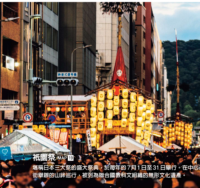
祇園祭 MAP 19

京都府的中心地區，曾維持「日本首都」的名號 1000 多年。不僅是寺院神社佛閣，各式祭典與文化等積年累月孕育出的古都傳統，至今仍發揮偌大的影響力。而不僅是古老優良的傳統文化，每次造訪都能在市街上有嶄新的發現。屬於千年古都的神秘魅力，值得您多次走訪發掘。