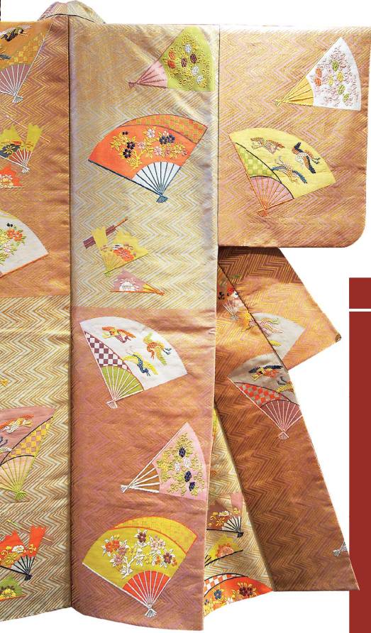
高級絹織品「西陣織」，自古即為和服及和式雜貨常用的布料。