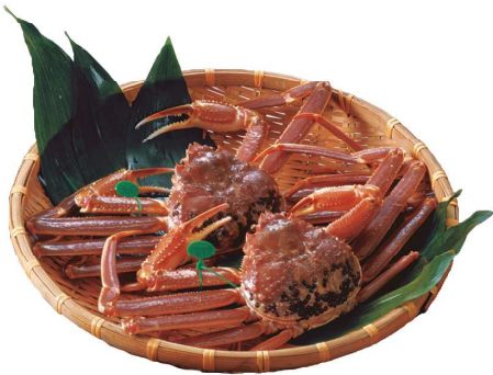
在海之京都，能品嚐日本海捕獲的松葉蟹，恬淡高雅的風味讓人齒頰留香。