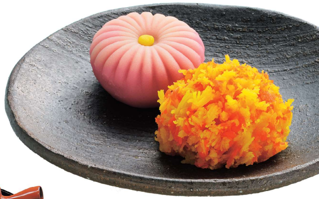
茶道中必不可少的和菓子，是按照当季花卉形状制作而成。