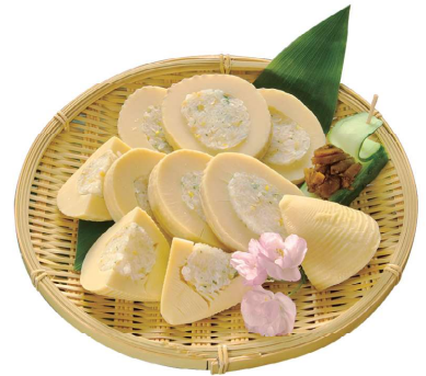
您可以通过各式各样的料理尽情品尝代表日本春季味道的竹笋的美味。