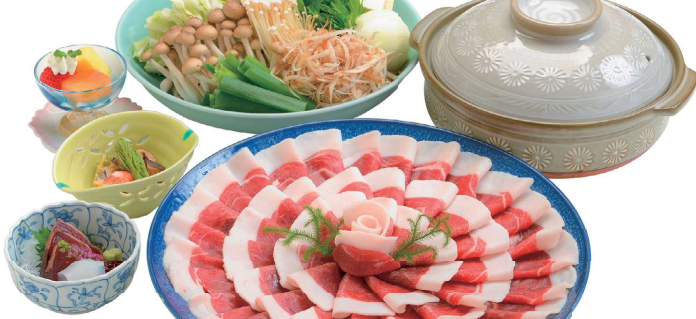
森之京都的乡土料理“牡丹锅”，以切薄的山猪肉片和蔬菜炖煮而成，挑逗您的味蕾。