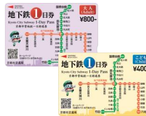
地下鉄1日券 Subway 1-Day Pass