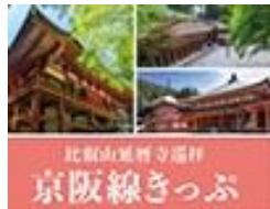
比叡山延暦寺巡拝 京阪線きっぷ

Hieizan Enryakuji Junpai Ticket Keihan Line 3/18から12/3まで有効 Valid from Mar.18-Dec.3 大人/Adult ¥ 3,700 子ども/Child ¥ 1,700