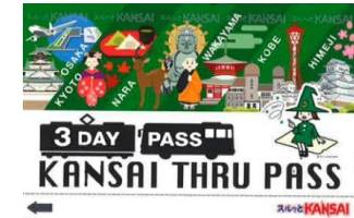
KANSAI THRU PASS 3 DAY PASS

※引き換えのみ (外国人旅客向け) Exchange only for foreign visitors