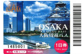
大阪周遊バス1日券 OSAKA AMAZING PASS 1-day Pass

Hieizan Enryakuji Junpai Ticket Otsu Line 3/18から12/3まで有効 Valid from Mar.18-Dec.3 大人/Adult ¥ 2,900 子ども/Child ¥ 1,300