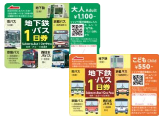
地下鉄・バス1日券 Subway & Bus 1-Day Pass