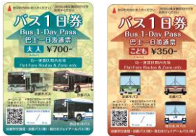
バス1日券 Bus 1-Day Pass

2023年9月30日までの販売 Sell until Sep. 30, 2023