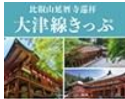
比叡山延暦寺巡拝 大津線きっぷ

Hieizan Enryakuji Junpai Ticket Keihan Line 3/18から12/3まで有効 Valid from Mar.18-Dec.3 大人/Adult ¥ 3,700 子ども/Child ¥ 1,700