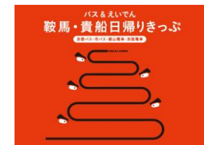
バス&えいでん 鞍馬・貴船日帰りきっぷ Kurama Kibune 1day Ticket