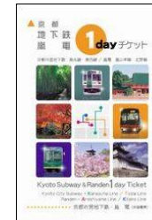
地下鉄・嵐電 1dayチケット Kyoto Subway & Randen 1day Ticket